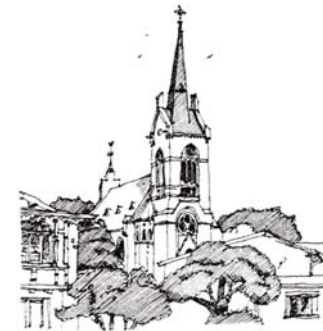
Grafik: Clemens Kolkwitz

Evangelische Kirche St. Michael, Krummin