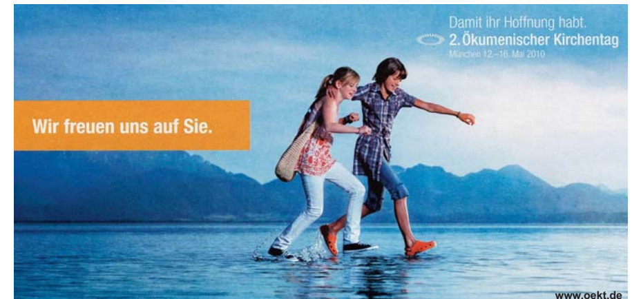
Eines der Plakatmotive zur Werbung für den 2. Ökumenischen Kirchentag in München.

Weit über 100.000 Teilnehmende werden zum 2. Ökumenischen Kirchentag vom 12. bis 16. Mai 2010 in München erwartet.