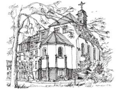
Grafik: Clemens Kolkwitz