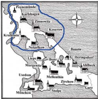
Originalgrafik: Clemens Kolkwitz