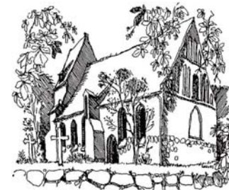
Grafik: Clemens Kolkwitz