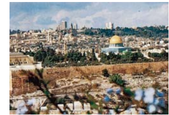
Jerusalem Bildbearbeitung: SG