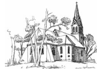
Grafik: Clemens Kolkwitz

Evangelische Kirche St. Michael, Krummin