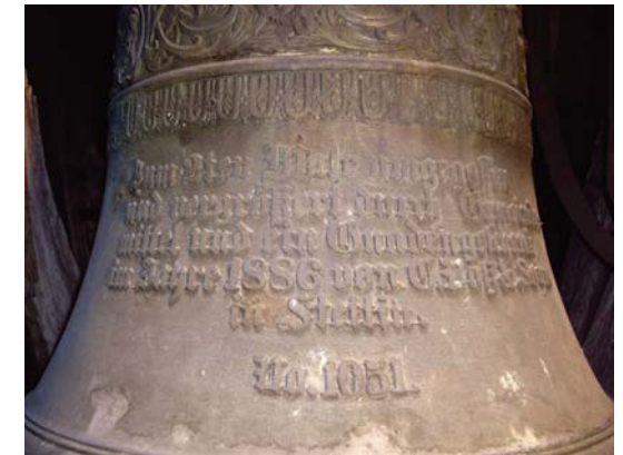
Koserower Glocke

Wegen Mängel am Glockenstuhl wollte schon im Jahre 2007 der Sachverständige die noch vorhandene Glocke stilllegen. Seitdem dürfen wir nur noch stark eingeschränkt läuten mit der Auflage, den Glockenstuhl baldmöglichst zu erneuern.